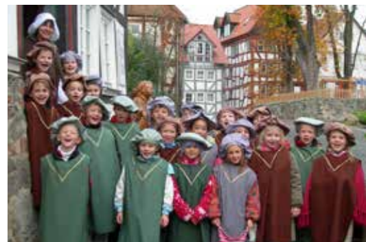
Stadtführungen in historischen Gewändern