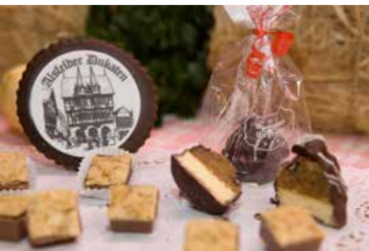
Alsfelds süße Verführungen: Küsschen, Dukaten und Pflastersteine