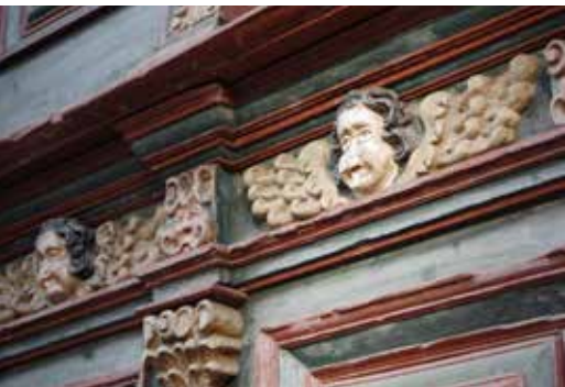
Engelsköpfe im Fachwerk integriert