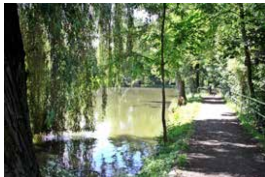
Rundgang um den Erlenteich