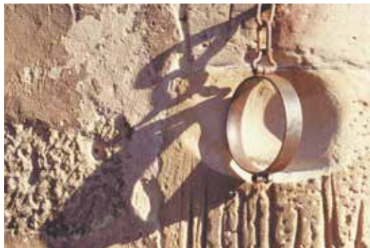
Strafinstrument im Mittelalter: der Pranger