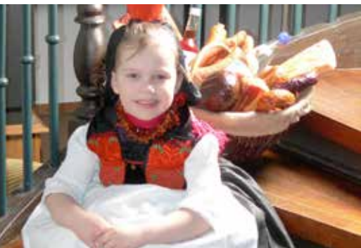
Rotkäppchen schenkt jedem ein Lächeln