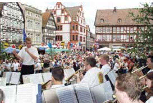
Alsfelder Stadt- & Heimatfest