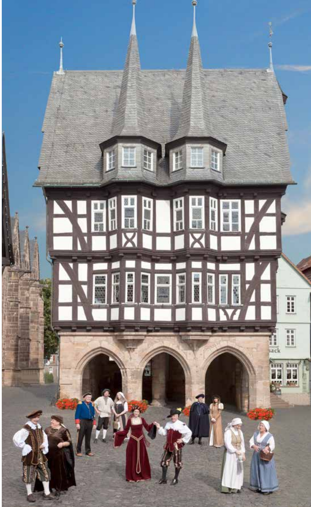
Regionalmuseum mit Neurath- und Minnigerodehaus