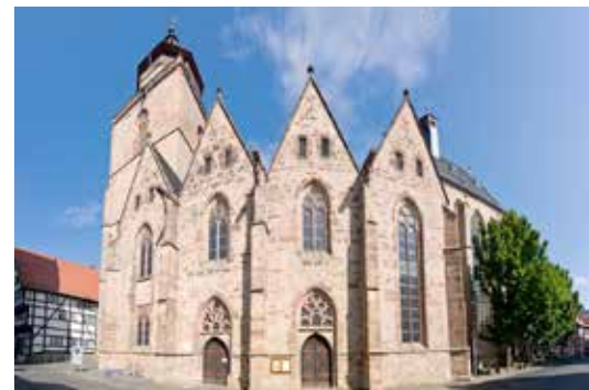
Walpurgiskirche, die Hauptkirche Alsfelds