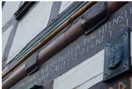
Inschriften finden sich an vielen Häusern