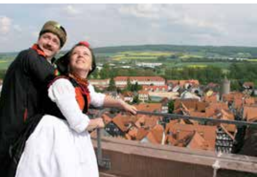
Aussicht vom Kirchturm