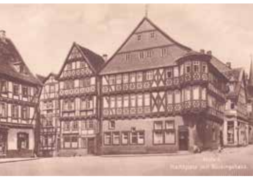
Bückinghaus am Marktplatz (1893)