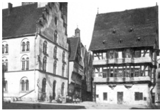
Marktplatz mit Weinhaus & Rathaus (1878)