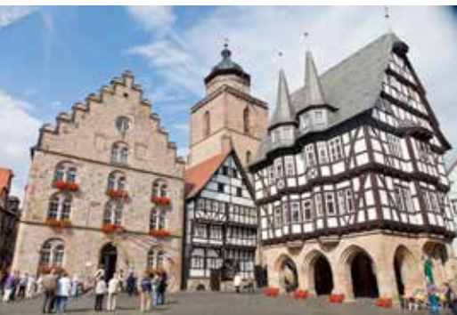
Das berühmte Marktplatzensemble Rathaus, Weinhaus und Markt 2