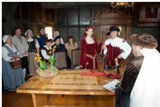
Der schönste Tag im Leben in Alsfeld.