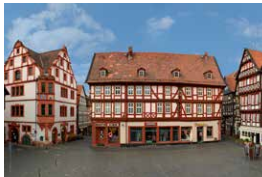
Hochzeitshaus, Stumpf-Haus und Bücking-Haus