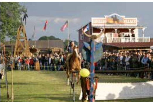
Die Westernstadt Lingelcreek