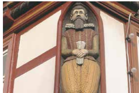
Schnitzwerk am frühesten Alsfelder Fachwerkhaus

Nur wenige Schritte weiter die Alsfelder Elle am Rathaus, exakt 60 cm lang.