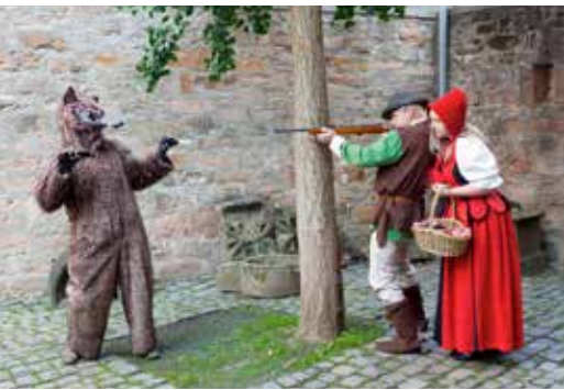
Rotkäppchen-Aufführung im Museumshof