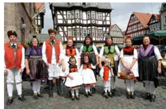
Rotkäppchenwoche im Rotkäppchenland

Die Alsfelder können feiern und laden gerne dazu ein, denn Feiern wird durch Gäste erst schön.