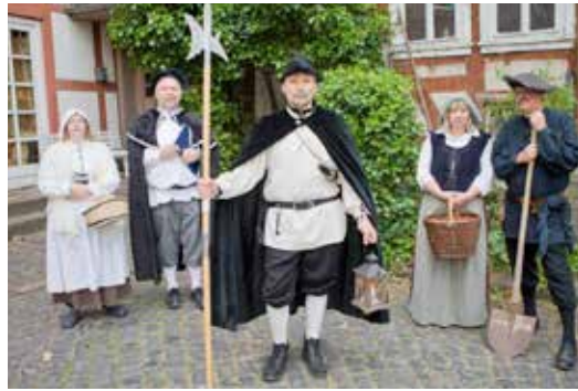
Rundgang mit dem Nachtwächter