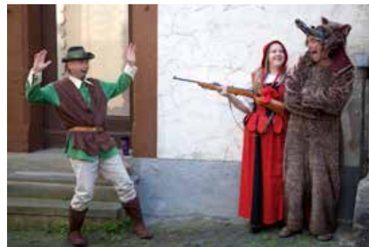
Für Sie schlüpfen wir in jede Rolle...