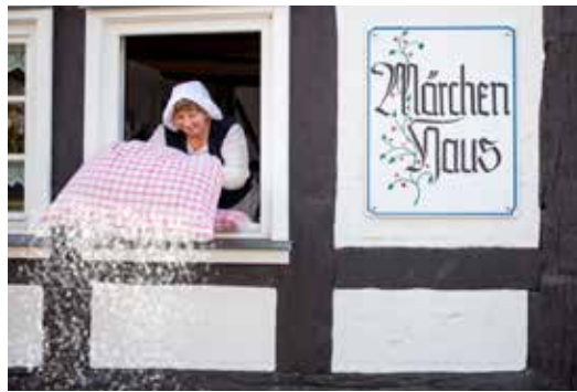
Frau Holle schüttelt ihre Betten aus