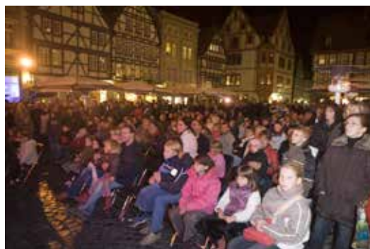
Zauberei & Varieté bei der Zauberhaften Nacht