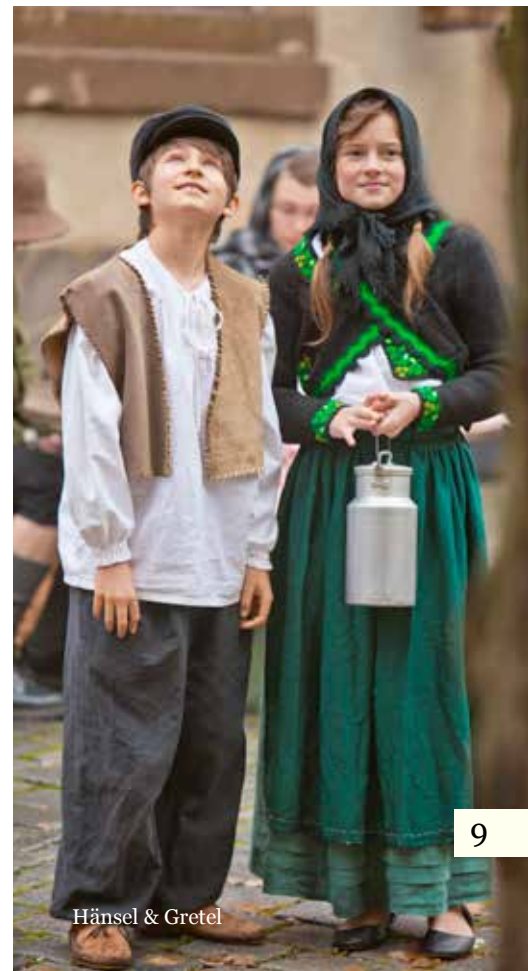
Hänsel & Gretel