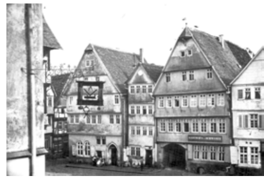
Marktplatz Südseite (um 1870)