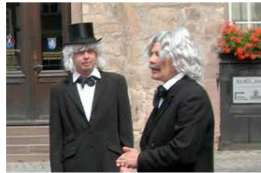
Märchenhafte Stadtführung mit den Brüdern Grimm