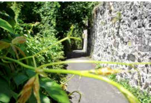
Stadtmauer am Klostermauerweg