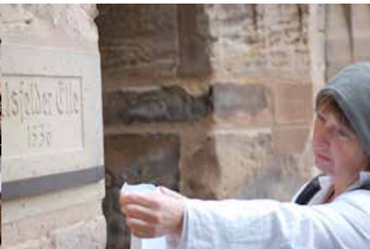
Die 60cm lange Alsfelder Elle am Rathaus