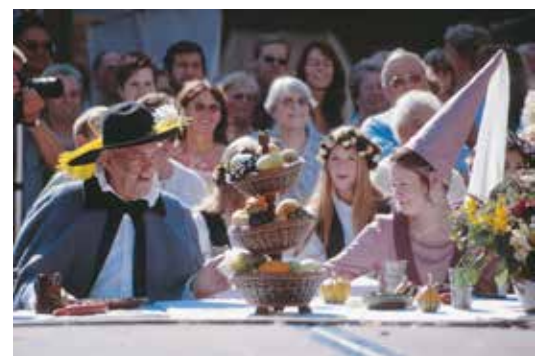
Beliebtes Fotomotiv: Das Weinhaus...