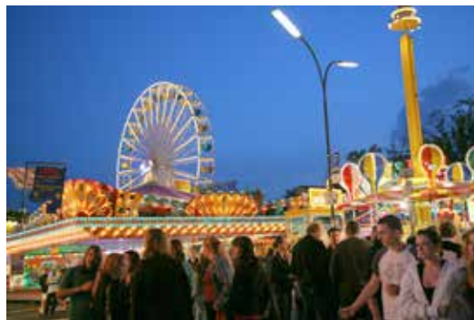
Alsfelder Pfingstmarkt - das größte Volksfest der Region